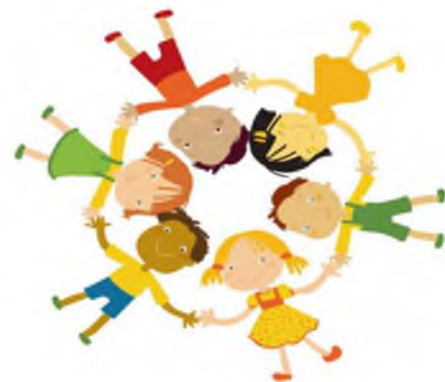
График работы Департамента образования:

693020, г Южно-Сахалинск, ул. Ленина, 172. Справочные телефоны Департамента образования: Приемная - (4242)723595; Факс -(4242) 722133.